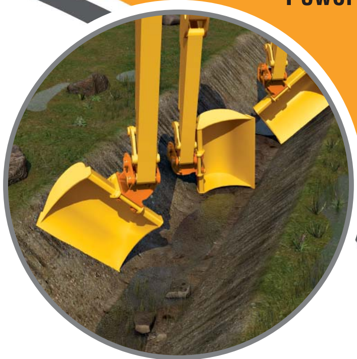
Limpieza de zanjas