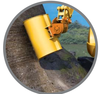
Modificación de suelos