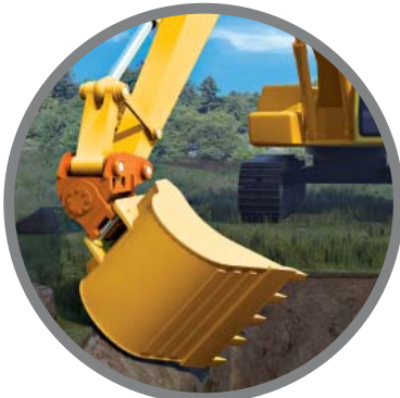
Seguridad en zanjas