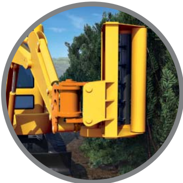
Poda de maleza