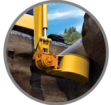
Servicios públicos subterráneos