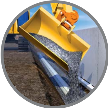
Medición de material de relleno